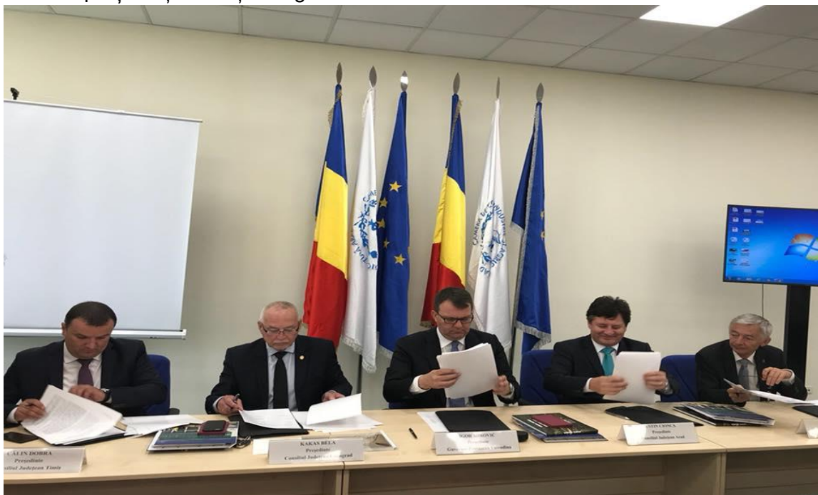
Semnarea protocolului de înființare a consorțiului euroregional Activarium

În acest fel, va fi îmbogățită oferta de activități și programe culturale pentru cetățenii acestor regiuni și oaspeții care vor vizita cele două capitale culturale. Varianta finală a protocolului de colaborare a fost semnată la Arad în data de 18 mai, de către președinții entităților regionale.