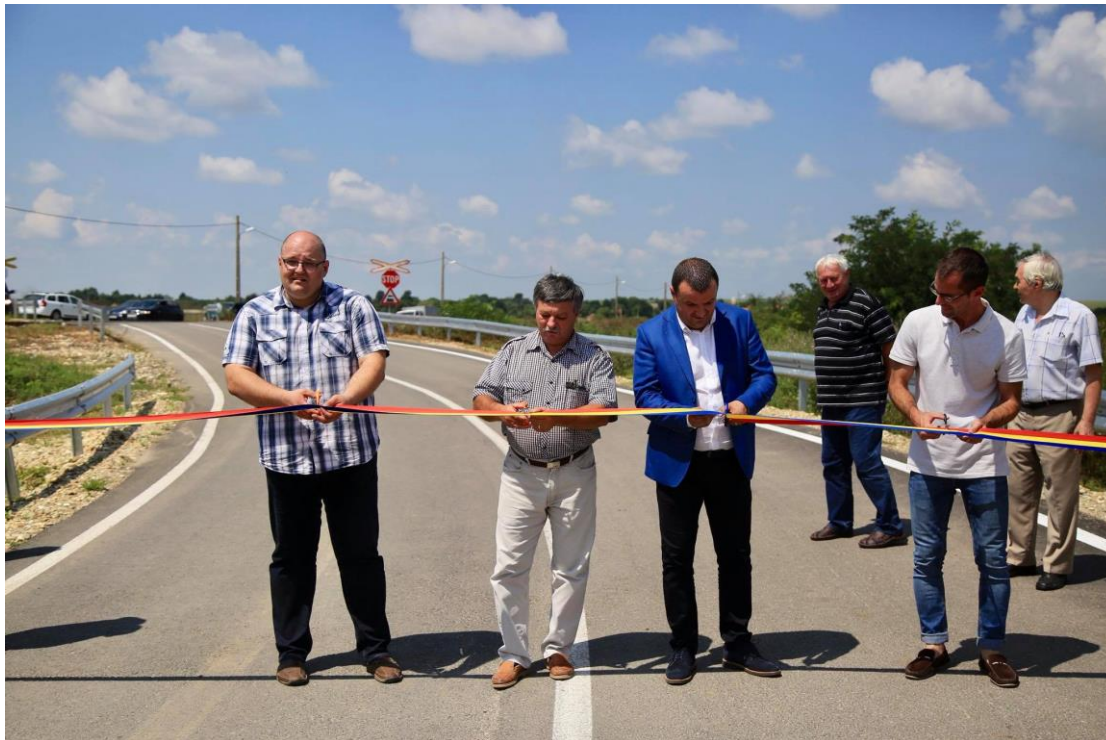
Asfaltarea DJ 588 Șemlacu Mare - Ferendia, în lungime de 4,4 km, valoarea totală a lucrărilor fiind de 4,5 milioane de lei, fonduri asigurate din bugetul de investiții al Consiliului Județean Timiș

Activitatea serviciului a constat în scrierea cererii de finanțare, completarea și transmiterea prin intermediul aplicației MySMIS a cererii de finanțare, a răspunsurilor la solicitările de clarificări până în etapa de precontractare. Proiectul a fost scris în colaborare cu Direcția Tehnică care a avut atribuții și responsabilități în coordonarea activității de elaborare a documentației tehnico-economice de către proiectantul contractat și în urmărirea contractului de lucrări.