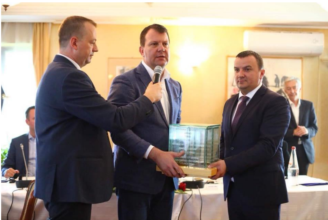
Preluarea de către județul Timiș a președinției cooperării euroregionale DKMT de la Regiunea Autonomă Vojvodina (Serbia)