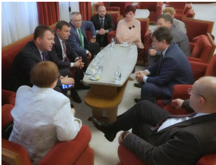
Discuție între președinții Euroregiunii DKMT

În acest an s-au împlinit 20 de ani de la semnarea protocolului de cooperare al Cooperării Regionale DKMT care a fost sărbătorit în data de 21 noiembrie la Novi Sad, Serbia.