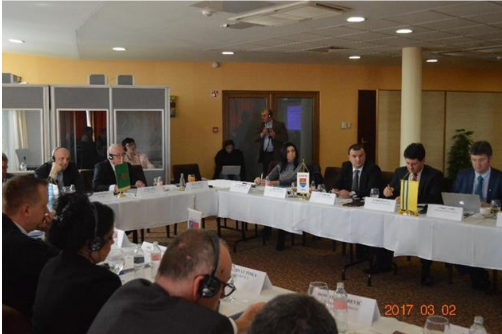
Ședința Adunării Generale a Cooperării Regionale DKMT din 2 martie 2017, Mórahalom, Ungaria

Conform tradiției, în data de 27 mai 2017 a avut loc deschiderea festivă a graniței la Triplex Confinium, urmată de ședința Adunării Generale a Cooperării Regionale DKMT și ședința Adunării Generale a Asociațiilor Agenției de Dezvoltare a DKMT la Kübekháza, Ungaria.