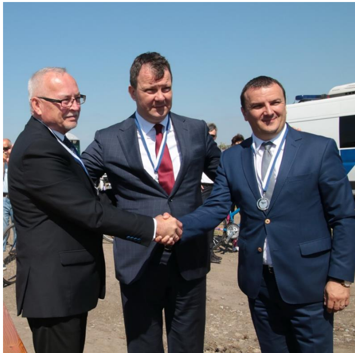
La festivitatea de deschidere a granițelor între România, Ungaria și Serbia la Triplex Confinium președinții Kakas Béla, Igor Mirović și Călin Dobra

Conform tradiției, în data de 27 mai 2017 a avut loc deschiderea festivă a graniței la Triplex Confinium, urmată de ședința Adunării Generale a Cooperării Regionale DKMT și ședința Adunării Generale a Asociațiilor Agenției de Dezvoltare a DKMT la Kübekháza, Ungaria.